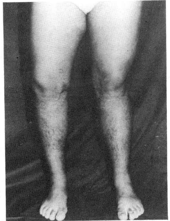
Fig. 1. Genu varo derecho. Genu valgo izquierdo.

Concluimos que la indicación de aplicación de epifisiodesis transitoria no se debe realizar muy precozmente pues, si fuera necesario retirarlas, el cartílago de crecimiento remanente puede desarrollarse en forma diferente a la esperada. Por otra parte, no está indicada la aplicación de grapas en la tibia por la sección triangular de este hueso, que impide la aplicación simétrica de las mismas.