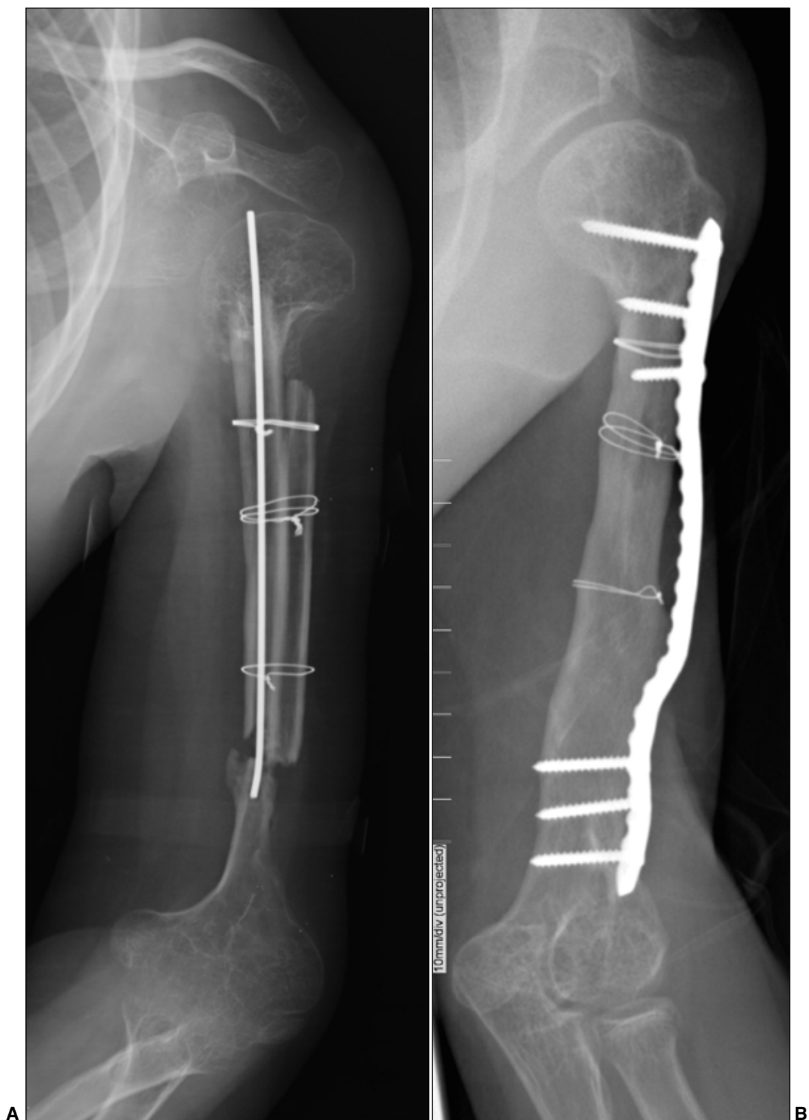
▲ Figura 2. A. Defecto óseo de 12 cm en el húmero, con extremos óseos atróficos. Injerto libre de peroné doble, no vascularizado, estabilizado con clavija. B. A los 8 meses, los extremos óseos se hipertrofiaron y se cambió la clavija por una placa LCP larga en onda y autoinjerto esponjoso en el extremo distal, con lo que se lograron la continuidad ósea, la estabilidad y la remodelación progresiva.