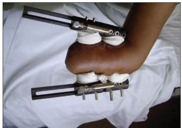
Figura 1. Elongación con tutor externo.

Cabe destacar que, antes de llevar a cabo el procedimiento en la izquierda, la paciente ya escribía con la pinza derecha.